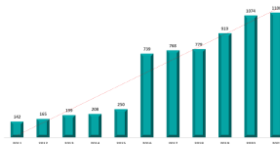
Evolução do Quadro de Profissionais com Deficiência

Vale destacar que a SPDM – Instituições Afiliadas ampliou consideravelmente os campos de trabalho para pessoas com deficiências, e isso é demonstrado através do gráfico abaixo, que demonstra que entre 2011 e 2021, aumentamos em 87% a quantidade de colaboradores com deficiências em nosso quadro.